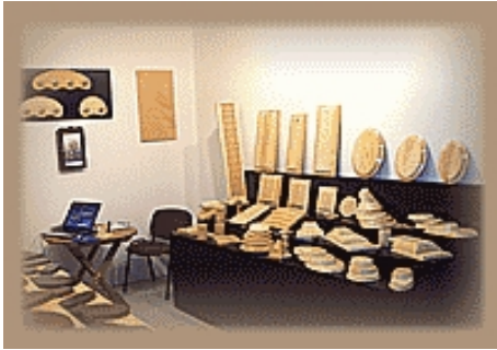
Detalle del Stand