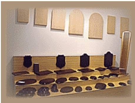
Detalle del Stand