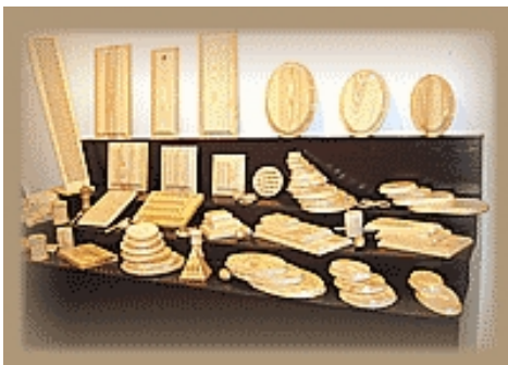
Detalle del Stand