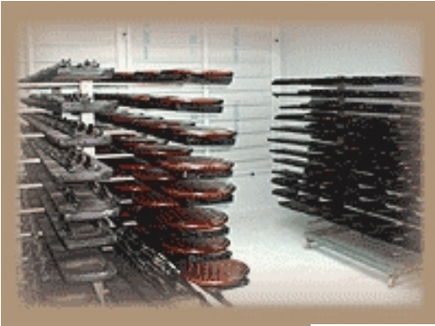
Detalle cámara de barnizado