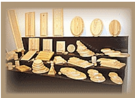
Detalle del Stand